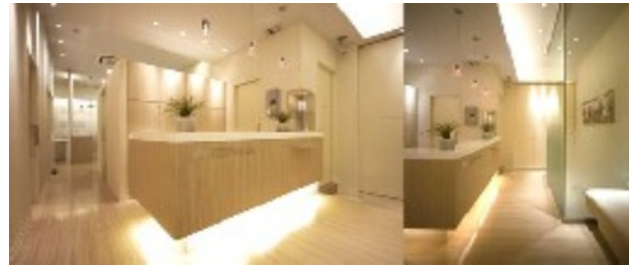
当院 受付・待合室

当院は認定医による矯正歯科専門のクリニックです。治療開始前のカウンセリングには十分な時間をとり納得して頂いた上で治療を行います。治療中の虫歯予防管理にも力を入れていますので安心して治療を受けて頂けます。