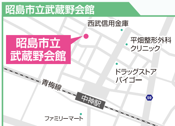
東京都昭島市中神町1172-1